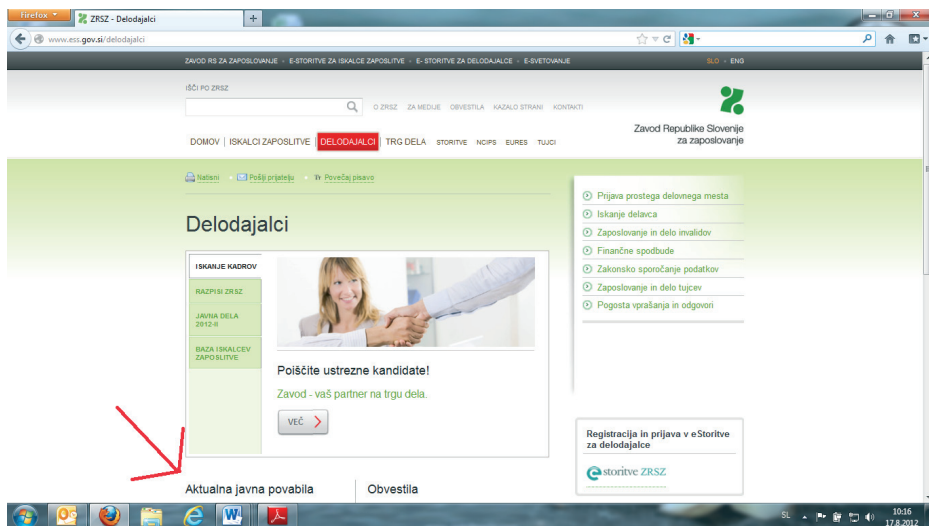
Slika 1: »ZRSZ – Aktualna javna povabila«

POMEMBNO: za dodelitev nepovratnih finančnih sredstev mora biti delodajalec izbran na javnem povabilu.