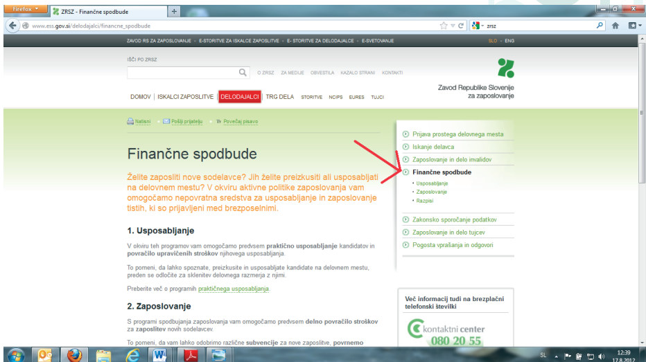
Slika 2: »ZRSZ – Finančne spodbude«

Delodajalci se lahko na portalu ZRSZ registrirane tudi kot uporabniki e-storitev portala za delodajalce , kjer lahko koristite e-storitve. Poleg ostalih bo zagotovo priročno oddati Prijavo prostega delovnega mesta, sporočiti spremembo ali oddati odjavo prostega delovnega mesta. Vse koristne in pomembne informacije s področja trga dela najdete na spletni strani ZRSZ http://www.ess.gov.si .